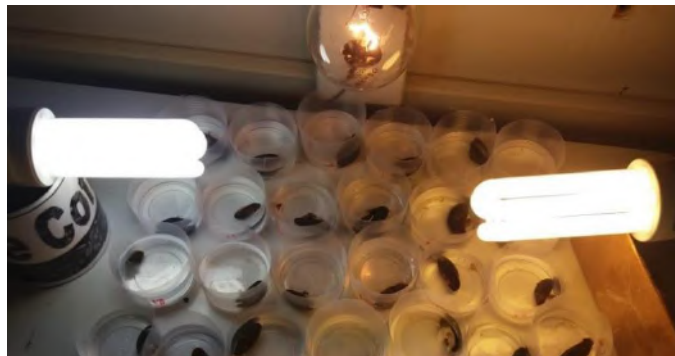
Figura 2. Fotoexposição à luz de L. fortunei para a liberação de potenciais parasitos.

Em laboratório os moluscos foram identificados, por meio de parâmetros conquiológicos e morfológicos (Pereira et al., 2012). Em seguida as espécies foram individualizados em 25 recipientes plásticos com 10 ml de água desclorada e submetidos a fotoestimulação (1 lâmpada halógena 60W, 1 lâmpada fluorescente branca morna de 20 W e 1 lâmpada fluorescente branca fria de 20 W) por 2 horas para a eventual liberação de parasitos (Figura 2). Após 2 horas cada recipiente foi submetido ao estereomicroscópio Bel Photonics com magnificação máxima de 100 X para verificação de potenciais parasitos.