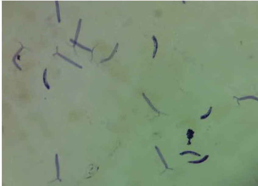
Figura 4. Cercárias encontradas após a fotoestimulação em Pomacea canaliculata .