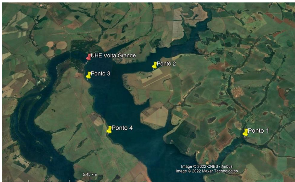
Figura 1. Área de estudo com os respectivos pontos amostrados (Ponto 1 a Ponto 4) destacado pelo marcador amarelo. Usina Hidrelétrica de Volta Grande apontado pelo marcador vermelho.

O estudo está dividido em duas metodologias, a primeira refere-se à inspeção anatômica dos mexilhões oriundos de quatro pontos (Ponto 1 a Ponto 4) no entorno do reservatório da Usina Hidrelétrica de Volta Grande na Bacia do Baixo Rio Grande. O Ponto 1 está localizado nas coordenadas S 20°05'33"; W 48°06'18". O Ponto 2 está localizado nas coordenadas S 20°04'10"; W 48°17'09", ambos pontos pertencentes ao Município de Água Comprida-MG. O Ponto 3 está localizado nas coordenadas S 20°02'57"; W 48°13'12" e por fim o Ponto 4 está localizado nas coordenadas S 20°09'07"; W 48°19'78", ambos situados no Município de Miguelópolis-SP (Figura 1).