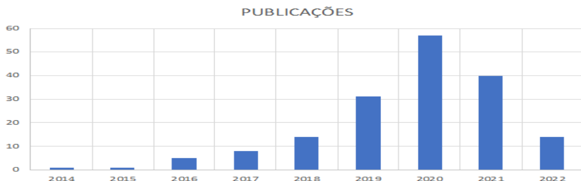
Gráfico 1. Quantidade de Publicações por Ano.

A distribuição no tempo, como pode ser visto pelo Gráfico 1, mostra um crescimento rápido nos primeiros anos e, depois de 2020 uma queda e estabilização.