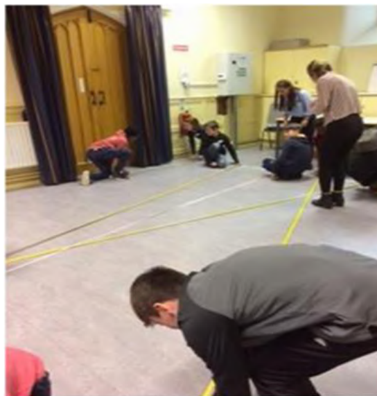
Figura 3 – Alunos medindo a distância percorrida pela caixa deles.

Dentre as sugestões, surgiu a ideia de usar um grande estilingue, o que levou o professor a ter um insight e sugerir que os estudantes criassem e usassem um protótipo de catapulta para transportar alimentos através do rio. Dessa forma, os alunos deveriam construir e testar suas catapultas com critérios pré-estabelecidos pelo professor. Na Figura 3, pode-se observar os alunos medindo a distância percorrida pelas caixas lançadas por suas catapultas.