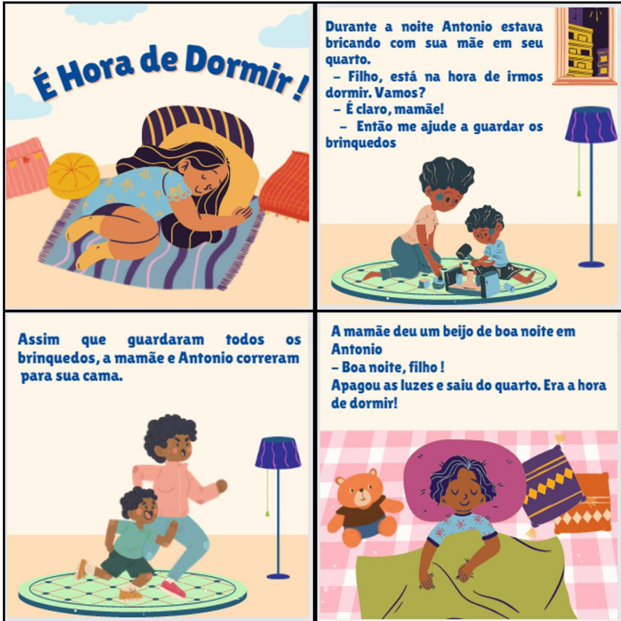
Figura 3 - Livreto nº 03 “Criando Hábitos na hora de dormir para a Criança”.

A Figura 3 abaixo, se refere ao Livreto nº 03 “Criando Hábitos na hora de dormir para a Criança”, como exemplo das atividades voltada aos pais.