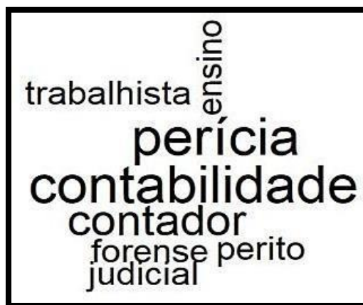
Figura 1 – Nuvem de palavras.

O pontapé inicial para descrever os resultados desta pesquisa, é através das nuvens de palavras, que na visão de Carvalho et al. (2019) representa uma análise lexical mais simples, porém graficamente interessante. Ou seja, a Nuvem de Palavras apresenta os termos que obtiveram a maior frequência em um corpus textual em um gráfico, possibilitando uma visão ampla dos termos e por consequência uma análise do pesquisador a partir das frequências. Sendo assim, para a realização da nuvem de palavras desse trabalho se realizou a consolidação dos 54 (Cinquenta e quatro) artigos que mais tiveram abordagens relevantes ao assunto. O gráfico que representa a frequência está expresso na Figura 1.