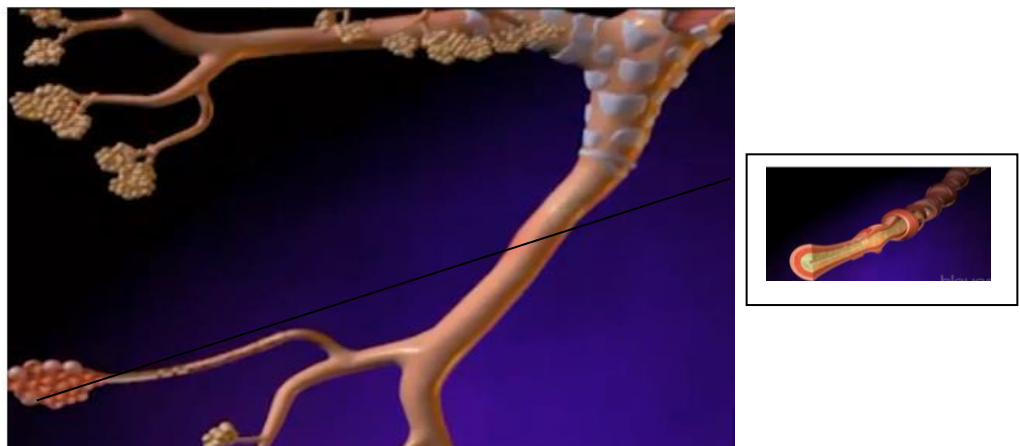
Figura 1 - Brônquios Enrijecidos e Obstruídos.