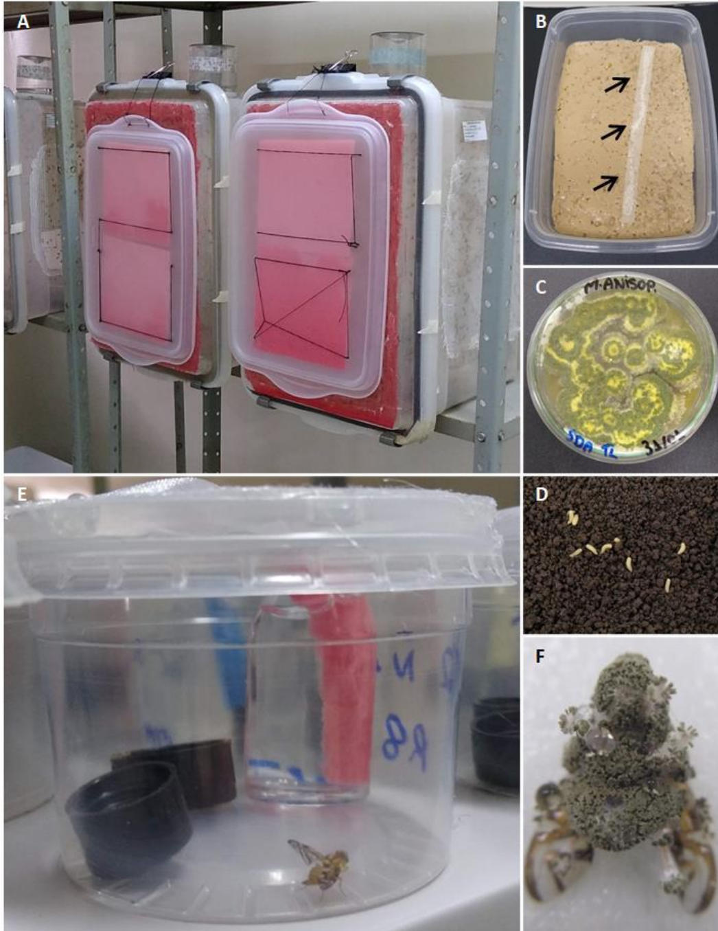
Figura 1. A) Gaiolas de criação de Anastrepha fraterculus em laboratório; B) Ovos de A. fraterculus dispostos sobre papel filtro, em dieta artificial (vide setas); C) Colônia de Metarhizium anisopliae CPAFAP-3.8; D) Larvas de Anastrepha fraterculus sobre o solo em caixa gerbox; E) Gaiola individual para adulto de Anastrepha fraterculus ; F) Adulto de A. fraterculus com exteriorização de sinais de Metarhizium anisopliae CPAFAP-3.8.