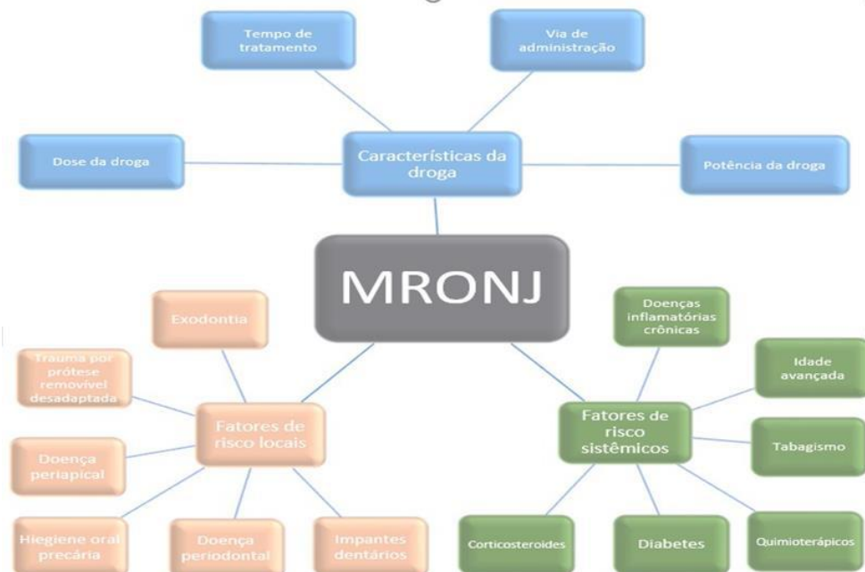
Figura 2: Fatores de risco da MRONJ (fatores de risco locais, sistêmicos e relacionados à droga).

Já os fatores de risco sistêmicos são os fatores que estão associados às condições de saúde do paciente, e os principais fatores de risco sistêmicos relatados pela literatura são: tratamento com quimioterapia, terapia com eritropoietina, hemodiálise, doenças inflamatórias crônicas, hipotireoidismo, corticoterapia, diabetes mellitus, idade avançada, tabagismo, obesidade e doenças da cavidade bucal. (Velaski et al., 2020).