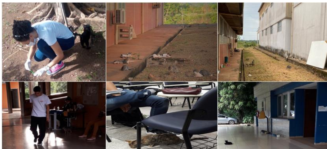
Figura 2 - Gatos errantes transitando pelo Campus UNIR Porto Velho.

De cada localidade, de onde esses felinos ficam em grupos devido à disposição da alimentação, obteve-se um “pool” amostral, um total de 12, no qual foram levadas para o laboratório de Histoanálise da UNIR (LABHIS/UNIR), localizado no CIBEBI – Centro Interdepartamental de Biologia Experimental e Biotecnologia. Esses locais investigados para coleta de material possui grande fluxo de pessoas diariamente (Figura 2).