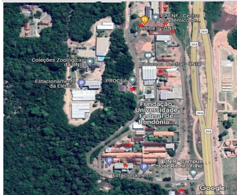
Figura 3 - Pontos de coleta pelo Campus UNIR Porto Velho/RO.

Legenda: Os asteriscos são os locais de coleta. Fc1/21 (Bloco 2K); Fc2/21 (Bloco 2K); Fc3/21 (Cantina II – Unir); Fc4/21 (Bloco 2J); Fc5/21 (Cantina II – Unir); Fc6/22 (Bloco 3B); Fc7/22 (Bloco 4A); Fc8/22 (Bloco 2B); Fc9/22 (Bloco 1E); Fc10/22 (Bloco 1T); Fc11/22 (Bloco 5C); Fc12/22 (Bloco 5E).