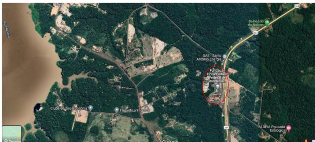
Figura 1 - Localização via satélite do Campus da Universidade Federal de Rondônia (UNIR) Porto Velho/RO.