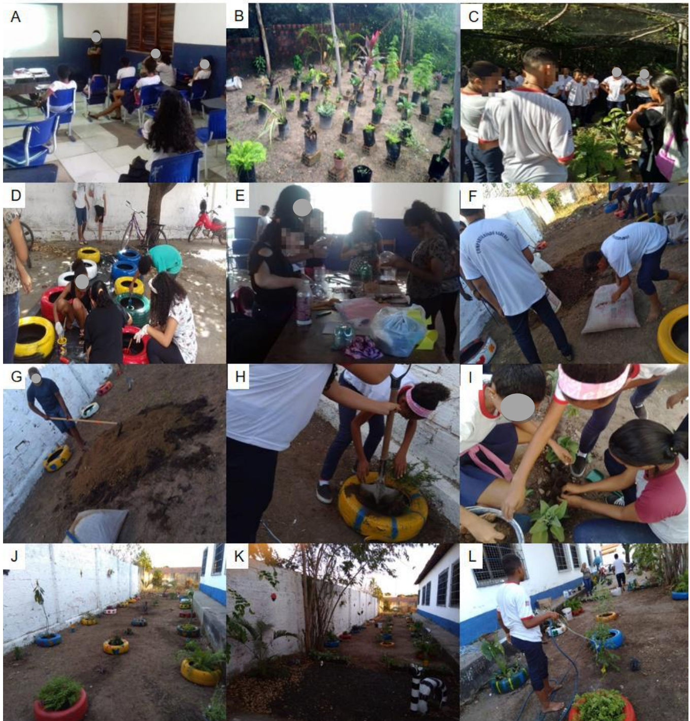
Figura 1 - Atividades propostas desenvolvidas na escola selecionada. A. Palestra na escola municipal sobre Educação Ambiental; B. Resultado final das mudas produzidas no CESC-UEMA; C. Alunos no local cultivo das plantas aprendendo sobre processo de cultivo; D. Alunos colorindo os pneus; E. Confeção com garrafa pet; F. Alunos fazendo mistura do adubo com areia vegetal; G. Mistura do adubo com areia vegetal; H. Alunas fazendo o plantio; I. Alunas aprendendo a fazerem o plantio das mudas; J. Parte final do jardim; K. Jardim finalizado; L. Aluno cuidando das plantas após uma visita na escola.