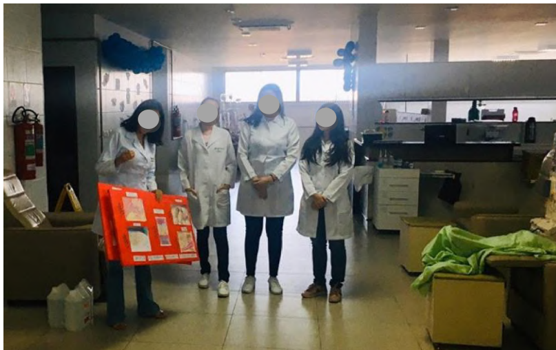
Figura 1 - apresentação sobre “Alimentação saudável no contexto do Diabetes Mellitus e da Hipertensão Arterial Sistêmica”.

A primeira ação, com o tema “Alimentação saudável no contexto do Diabetes Mellitus e da Hipertensão Arterial Sistêmica”, foi realizada em novembro de 2019, como parte das ações programadas para o mês de Cuidado à Saúde do Homem e Dia Mundial do Diabetes. Na ocasião os discentes do curso de graduação em Nutrição da FACISA-UFRN, integrantes da equipe do projeto, e a Nutricionista, integrante da equipe de profissionais do Centro de Nefrologia, fizeram, com o auxílio dos cartazes ilustrativos, a apresentação dialogada sobre o tema proposto conforme Figura 1.