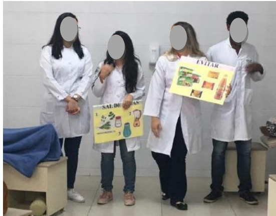
Figura 2 - Orientação sobre a redução do consumo de temperos industrializados.