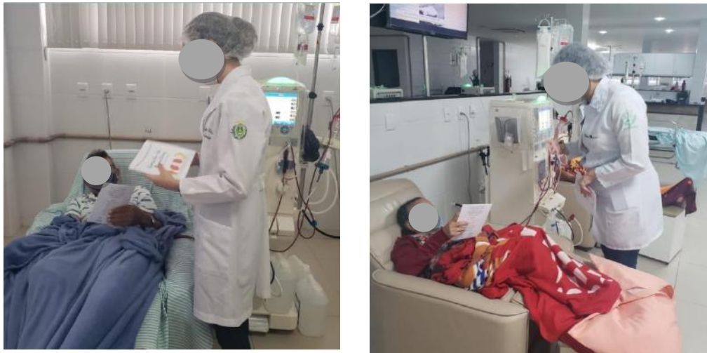
Figuras 4 e 5 - Entrega e esclarecimento sobre o livreto ilustrado de receitas.