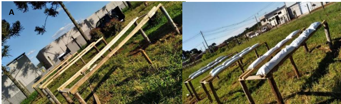
Figura 2 – A) madeiramentos das estruturas para formação das bancadas; B) slabs preenchidos com substrato sobre as bancadas.

sendo 2 caibros em cada extremidade da estufa (Figura 2A) espaçados por 0,10 m (este espaçamento varia de acordo com a largura da fileira escolhida). Sobre os caibros foram colocados slabs de 0,32 m x 0,50 m já contendo o substrato (Figura 2B). Os slabs foram comprados por metro, sendo necessário realizar o corte, abastecimento com substrato e fechamento de cada saco.