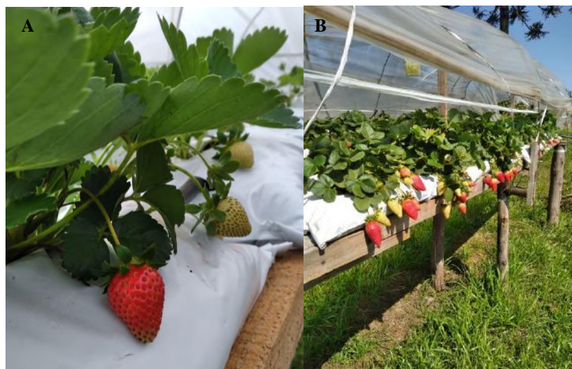
Figura 6 - A) Morangos produzidos após 60 dias da conclusão da construção; B) Produção no ano seguinte a construção (2022).

Na proposta apresentada e implantada, foi possível perceber a produção de morangos, após 60 dias do transplante (Figura 6A). Em uma avaliação, um ano após a implementação das estruturas (junho a outubro de 2022), foi percebido o auge da produção dos morangos, estes que se apresentaram saudáveis e com as características organolépticas adequadas a cultura (Figura 6B).