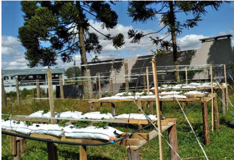
Figura 3 - Confeção da estrutura do telhado e linhas de fixação.