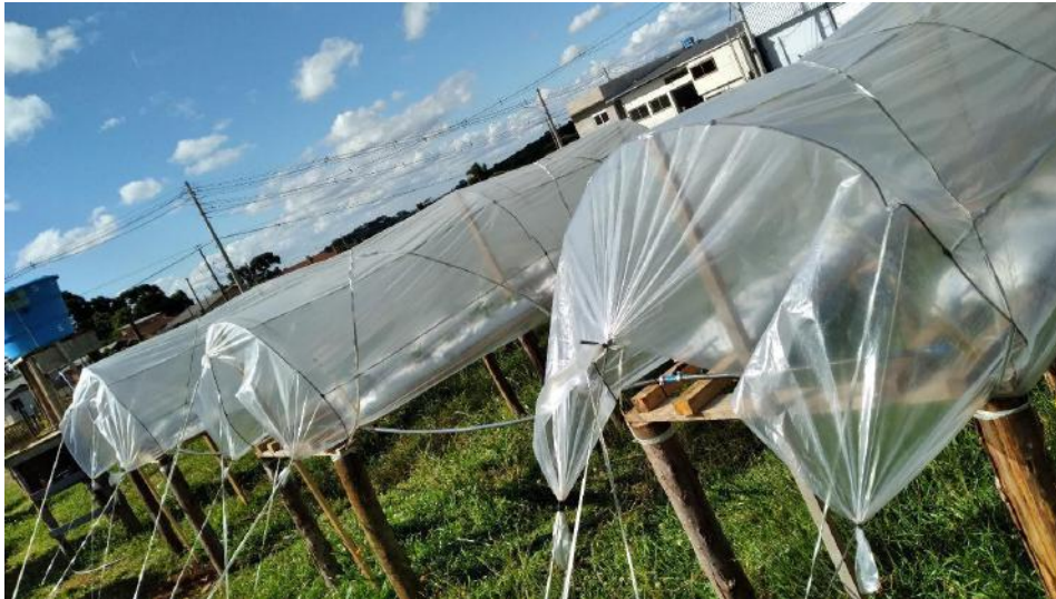
Figura 4 - Finalização do telhado em TB com lona agrícola.