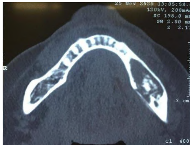
Figura 1 - Corte transversal mandibular, se observa secuestro óseo en cuerpo mandibular izquierdo.

Se realizaron exámenes complementarios como hemograma completo y exámenes microbiológicos el cual reportó presencia de Pseudomonas streptococo . Los exámenes radiográficos (ortopantomografía y Tomografía computarizada), revelaron una lesión lítica, expansiva del cuerpo mandibular izquierdo y zonas radiopacas compatibles con secuestros óseos (Figura 1).