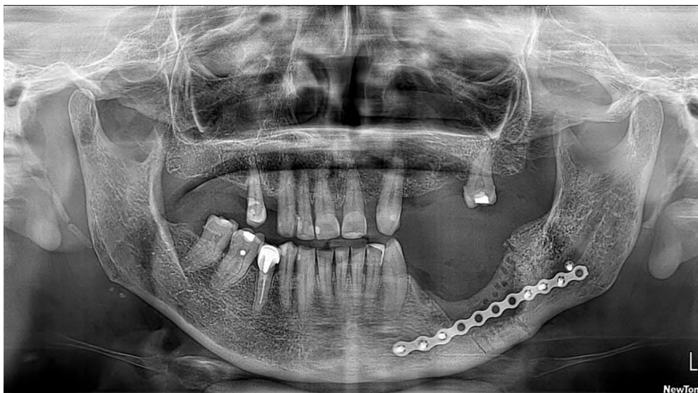
Figura 3 - Radiografía de Control.