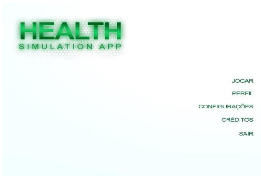
Figura 1 - Interface de acesso ao Health Simulator.

O aluno abre o simulador e é apresentada a tela inicial, na qual é preciso colocar os seus dados de identificação, como nome e senha de acesso. Neste estudo, os estudantes foram identificados por números, e não foi necessário cadastrar a senha, e posteriormente, eram direcionados para a tela de acesso ao simulador (Figura 1).