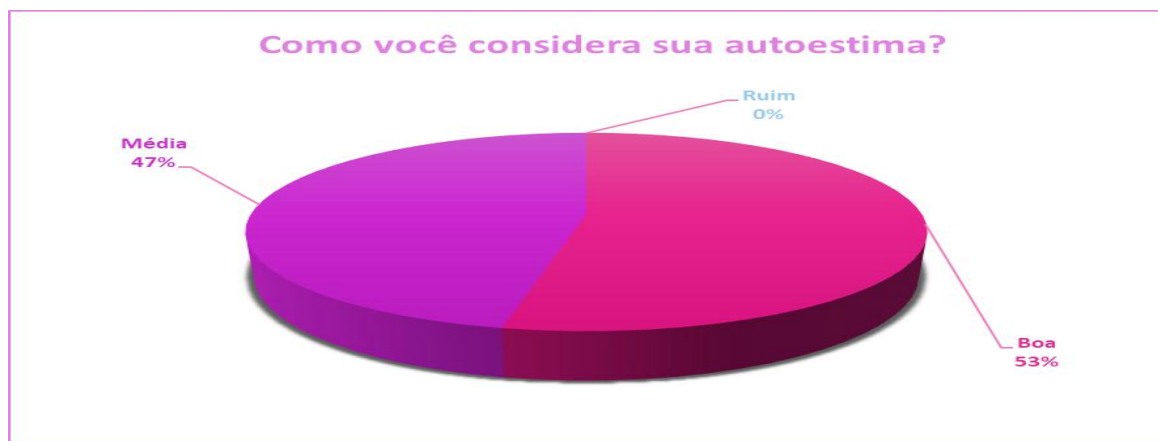
Gráfico 2 - A forma de classificação da autoestima das participantes.

As participantes do estudo puderam descrever como cada uma acredita que seja sua autoestima, sendo a maioria com 53% (oito), consideram-se ter uma boa autoestima. Os 47% (sete) restantes declararam ter uma autoestima média, desse modo 0% das participantes admitiram ter uma autoestima ruim, como é possível ver no Gráfico 2 a seguir: