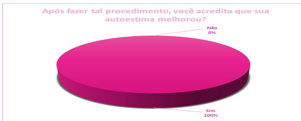
Gráfico 3 - Entendimento sobre a melhora da autoestima após procedimentos.

As entrevistadas avaliaram se sua autoestima melhorou ou não depois de realizar os procedimentos e 100% delas confirmaram que houve melhora na autoestima, como está descrito no Gráfico 3 em seguida: