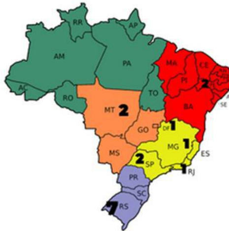
Figura 2 – Mapa.