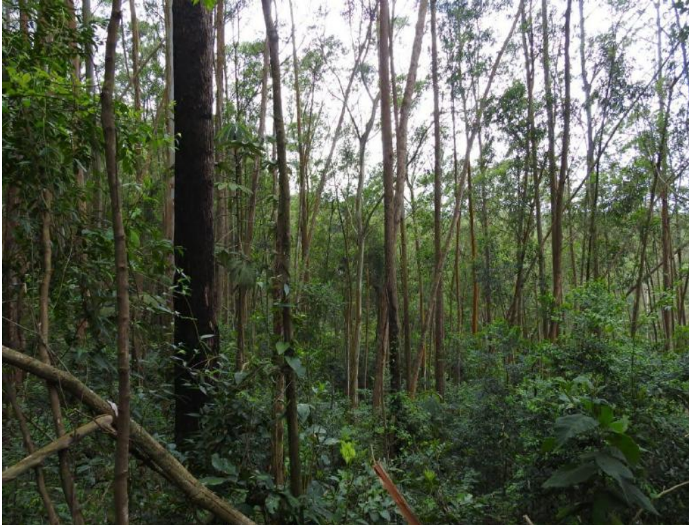
Figura 2 - Vegetação nativa se desenvolvendo em talhão de Eucalyptus sp., na Reserva Particular de Patrimônio Natural-RPPN-Botujuru, município de Mogi das Cruzes, SP.