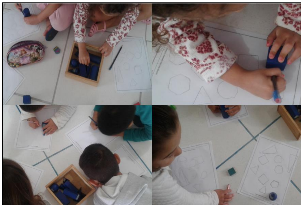
Figura 1: Descobrimo as formas planas através das figuras espaciais.

conhecimentos prévios sobre quadrados, retângulos, triângulos e círculos. Nessa etapa da atividade foi usado sólidos de madeira por serem resistentes e ter em quantidade suficiente na escola para atender a demanda de alunos. A Figura 1 mostra algumas produções dos alunos.