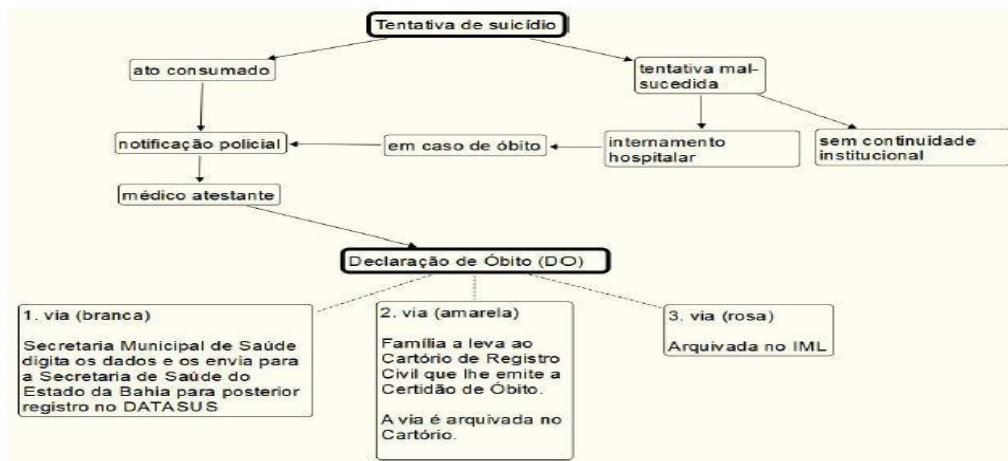
Figura 3 - Fluxo de registro de mortes por suicídio.

Fonte: Azos, IBGE, Governo Federal (2019).