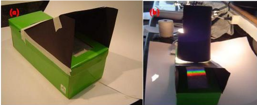
Figura 3 - (a) caixa pronta, e (b) visualização do espectro da lâmpada na tela de papel de seda.