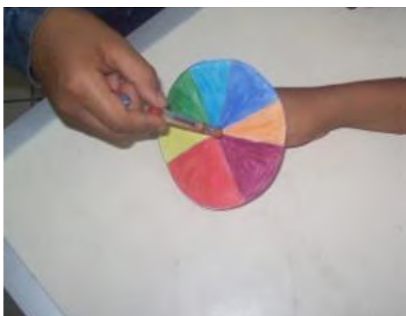
Figura 1 - Disco de Newton. Ele serve para demonstrar que a luz branca é constituída pela composição de luz de diferentes cores do espectro

O material pedagógico desenvolvido consistiu em dois experimentos com enfoque em conceitos de astronomia e feitos para serem utilizados simultaneamente. Foram eles: disco de Newton e o espectroscópio. Para a construção do disco de Newton foram utilizados: Cartolina branca; Compact Disc (CD); transferidor; Lápis de cor, giz de cera; Régua; Tesoura. Utilizando um CD, fazer círculos de cartolina. Utilizando o transferidor dividiu-se o círculo em sete partes (cada parte foi de aproximadamente 50°), colorindo cada uma das partes com as cores do arco-íris. Em seguida, o papel foi furado no centro do disco inserindo um lápis nesta região, tal como indica na Figura 1.