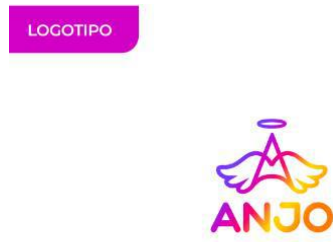
Figura 2 – Logotipo do aplicativo ANJO.