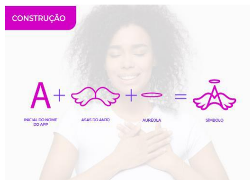
Figura 1 – Criação do logotipo do aplicativo ANJO.