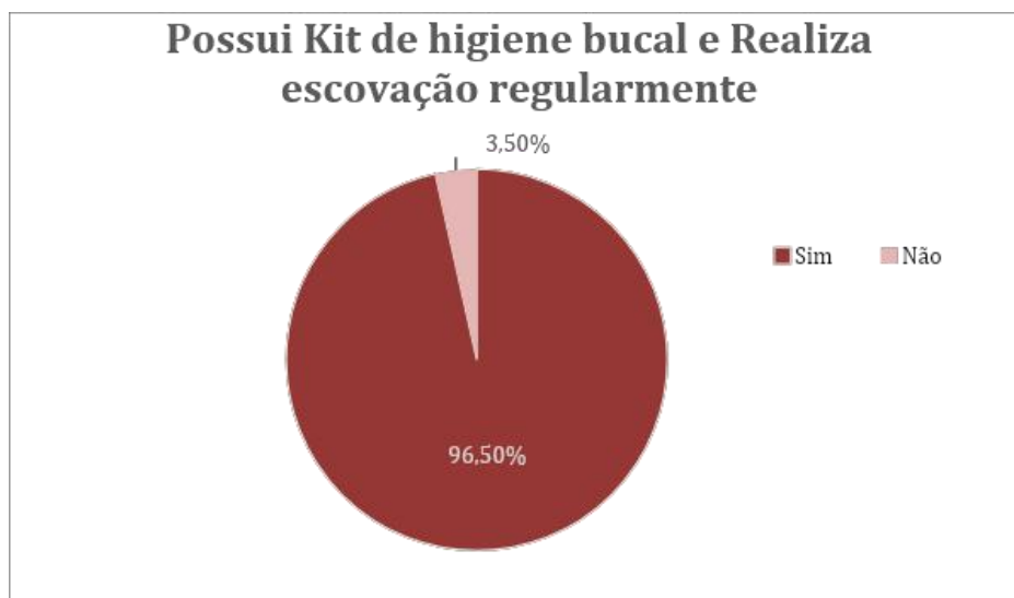
Figura 2 - Referente a kits de higiene bucal e se realizam escovação regularmente durante a hospitalização.