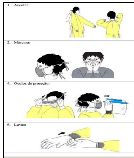
Figura 2 - Equipamentos de proteção individual.