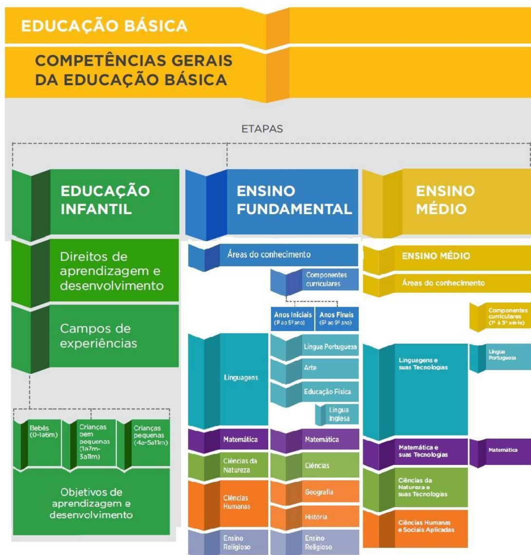
Figura 1 - Estrutura da BNCC.