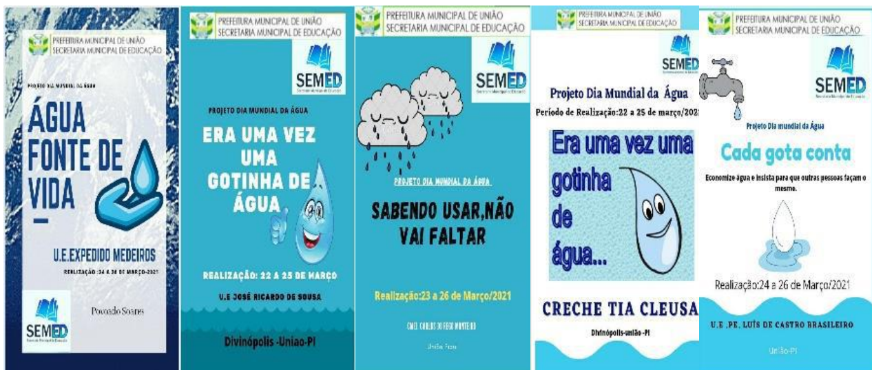
Figura 3 – Cards digitais com as temáticas abordadas nas instituições de ensino municipal de União, Piauí, Brasil, para abordagem de cada projeto interdisciplinar desenvolvido nas escolas na pandemia da Covid-19.