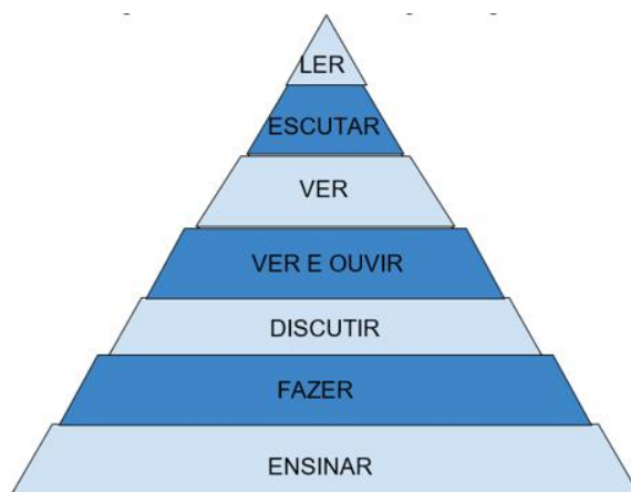
Figura 2 - Representação da Pirâmide de Aprendizagem.

Diante da forma como esse processo tem se solidificado, é preciso ampliar o entendimento e como ele é compreendido. O processo é considerado muito importante, pois dentro do sistema de ensino-aprendizagem, é como ele realmente se desenvolve. Os autores destacam que, para entender melhor, há uma teoria que existe e que precisa ser desenvolvida a partir de uma série de etapas, onde a imagem abaixo apresenta a pirâmide de aprendizagem e como ela se relaciona dentro de um processo educativo (Carotenuto & Pereira, 2020).