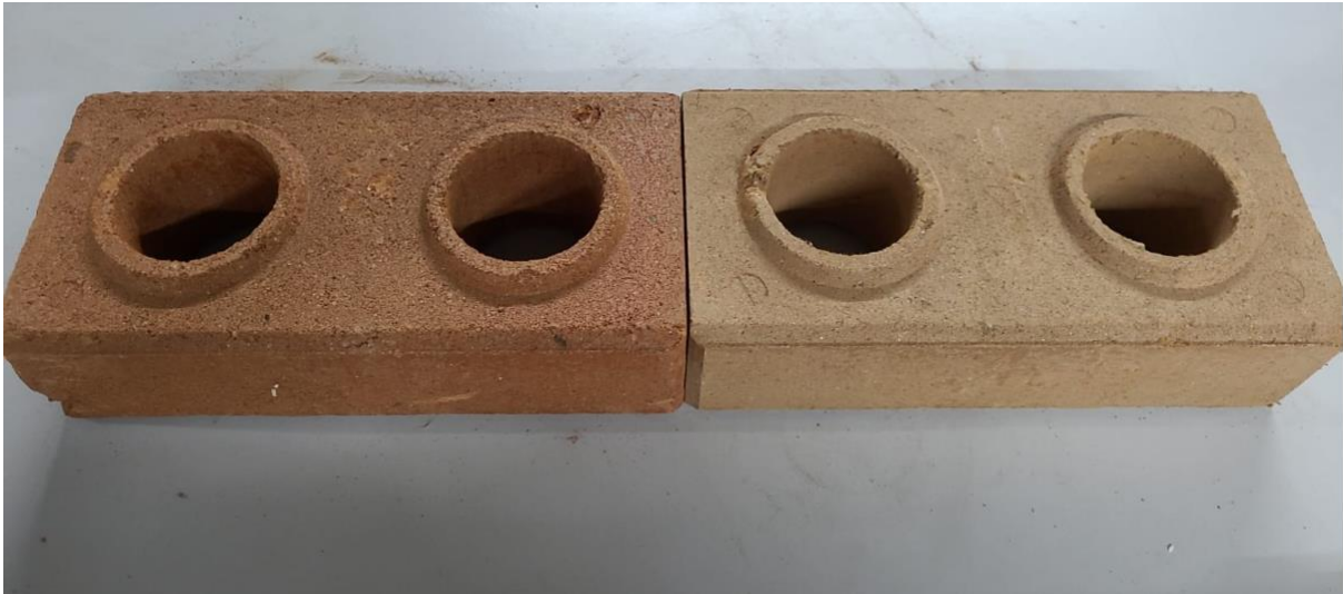
Figura 2 - Comparação superficial entre Tijolos Ecológicos.