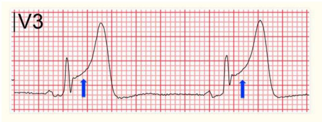
Figura 1 - ECG com elevação do segmento ST, indicado pelas setas que confirmam o IAMCSST.