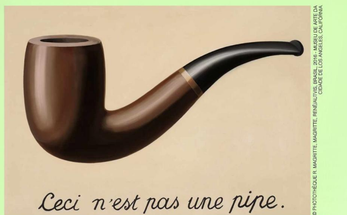
A traição das imagens ou Isso não é um cachimbo (1929), pintura de René Magritte.

Em sua opinião, o que o artista quis dizer com esta obra?