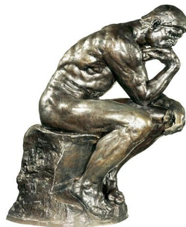
Figura 5 - O pensador de Rodin

A fim de que se analise uma amostragem suficientemente abrangente, que contemple as principais categorias visuais presentes na obra estudada, se faz necessário incluir mais uma manifestação visual: a história em quadrinhos. Conceituada como a arte de contar histórias por meio de desenhos e textos dispostos em sequência, os quadrinhos possuem diversos formatos, o que facilita sua seleção para finalidades didáticas.