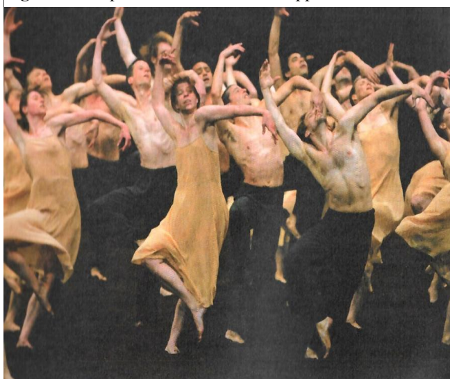
Figura 2 - Espetáculo Tanztheater Wuppertal.

Nesse sentido, a autora aponta para os fins da educação politécnica, que seria desenvolver o homem na sua potencialidade, desenvolvendo todas as suas características humanas de forma integral.