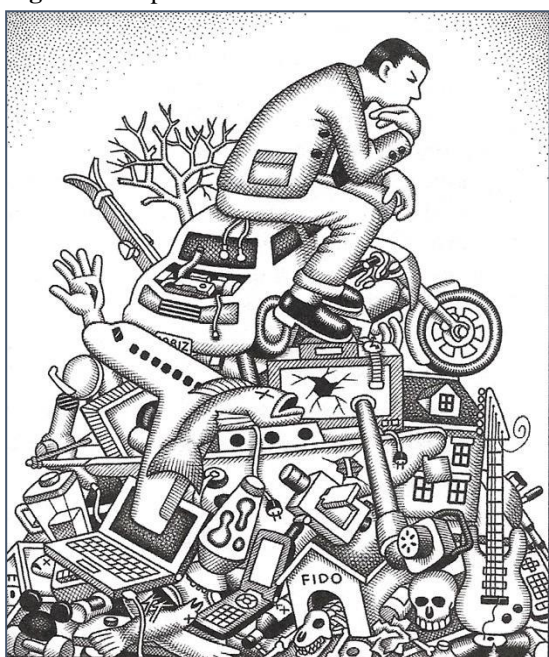
Figura 4 - O pensador moderno de Andrew

Para Magritte, a arte deve ser entendida não como a realidade, mas como uma representação desta. Dentro do livro, a imagem em questão se encontra na página 73, do capítulo 3, cujo título é “O que é realidade? A descoberta do mundo suprassensível”. Sua função didático-reflexiva se explicita já que a obra está inserida em um quadro destacado na página, onde se observa um convite à reflexão no título: “Para pensar”. Segue-se, no interior do quadro a pergunta: “Na sua opinião, o que o artista quis dizer com esta obra?” Se estabelece nesse momento o espaço propício seja para atividades em grupo, no qual cada aluno pode indicar suas percepções acerca de sua experiência visual, bem como para atividades individuais, que levem o discente a dissertar sobre o tema, refletindo sobre ele, pesquisando, fazendo associações etc. Mais do que um simples complemento do texto, cuja função seria enriquecer as palavras, ilustrando-as, o recurso visual em destaque se configura, nesse caso, como o elemento reflexivo central, sem o qual a atividade pedagógica não se realizaria.