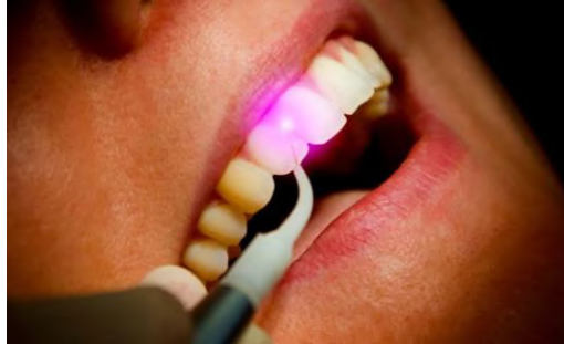
Figura 7 - Uso de terapia de láser de baja intensidad.