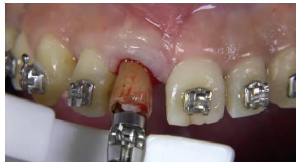
Figura 5 - Sistema de extracción vertical por acción de poleas.