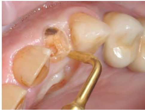
Figura 4 - Ejemplo de uso clínico de piezocirugía.