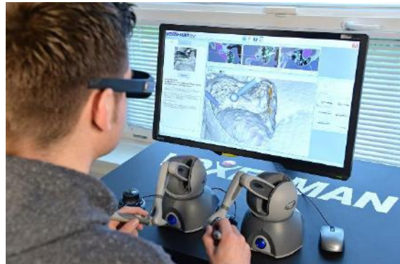
Figura 2 - Simulador de formación virtual VOXEL-MAN.

Los avances tecnológicos, sobre todo en el campo de la realidad aumentada, están permitiendo un avance significativo en el apartado de preparación y planificación de cualquier caso a conllevar, estos mismos se transfieren al campo quirúrgico a través de guías estáticas o navegación dinámica. Además de una ayuda al momento de realizar la planificación del caso, también son un punto interesante a investigar debido a su ayuda en la práctica de distintas incisiones, levantamientos de colgajos, procesos de apoyo para exodoncias, osteotomías y ostectomías, donde en el estudio “The application of virtual reality and augmented reality in Oral & Maxillofacial Surgery” se analizó el uso del software “Voxel Man Simulator” para la práctica de exodoncias de 53 estudiantes, donde el resultado fue sorprendente al arrojar datos que 51 estudiantes pudieron al cabo de días, mostrar resultados positivos en dichos procedimientos (Bartella, 2019).