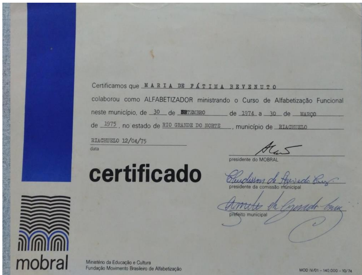
Figura 03: Diploma de Alfabetizadora