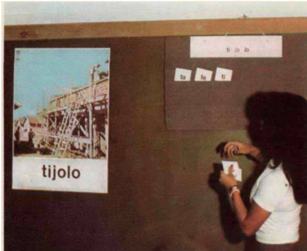
Figura 02: Professora Alfabetizadora

inserção crítica, política e era usada como método de repetição. Aliás, essa foi uma grande crítica a esse modelo de alfabetização. Vejamos: