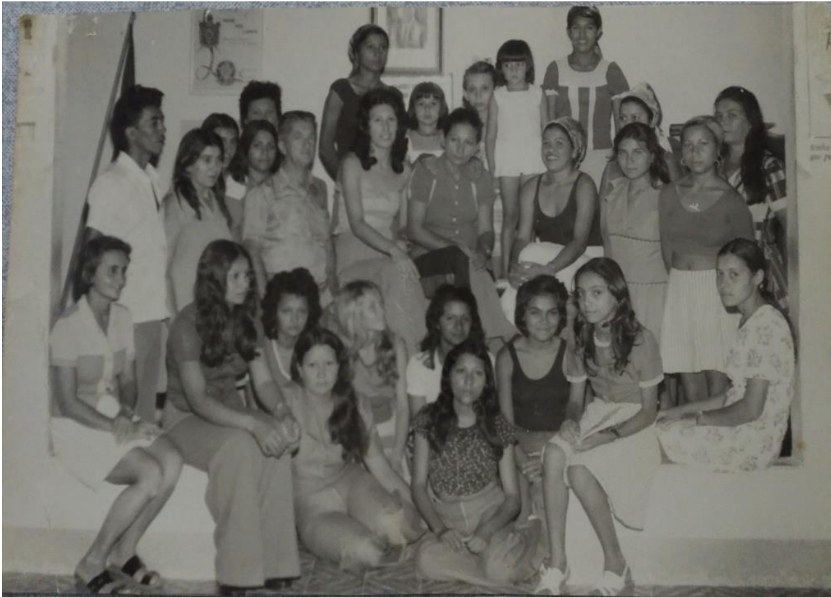
Figura 05: Encontro de capacitação em 1975

Fonte: Acervo fotográfico de Fátima Bevenuto. 5 (Fotografia gentilmente cedida pela professora).