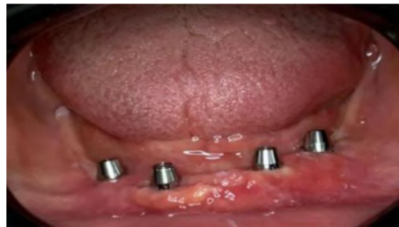
Figura 2 - Instalação dos mini-pilares (Implacil Bortoli São Paulo, São Paulo, Brasil) sobre os implantes.

Foi realizado a remoção dos cicatrizadores para seleção dos minipilares. Os mini-pilares Implacil Bortoli (São Paulo, São Paulo, Brasil), anteriores foram escolhidos com a cinta de 2,5mm os distais com 3,5mm e instalados com torque de 32N. (Figura 2)