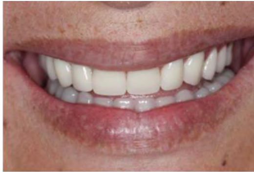
Figura 9 – Instalação das próteses, total superior e inferior do tipo protocolo.