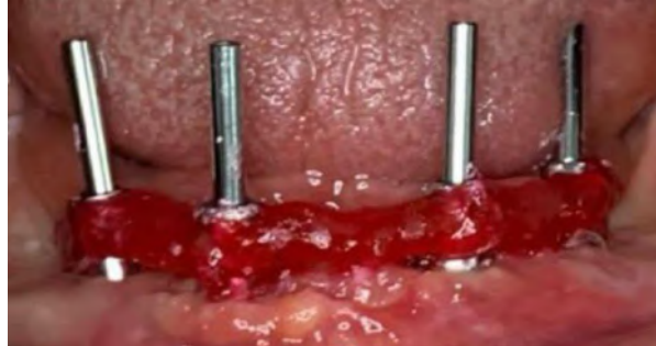
Figura 4 – União dos transferentes com resina acrílica (Pattern Resintm LS - GM América, São Paulo – São Paulo – Brazil).

Já na Figura 4, pode-se observar a união dos tranferentes por meio de resina acrílica: