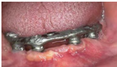
Figura 8 – Instalação da barra sobre mini-pilares Com as provas dos dentes aprovadas e adaptadas junto a barra, foi realizado a instalação da prótese total removível superior e inferior parafusada do tipo protocolo (Figura 9)

As medidas das linhas do sorriso possibilitam o laboratório instalar dentes sobre a cera de forma alinhada e harmônica com o formato de rosto do paciente. Com a prova desta etapa e aprovação do paciente, será provado uma barra metálica. Essa barra metálica consiste na reta final do procedimento laboratorial, onde a mesma, caso bem adaptada possibilitará a instalação da prótese em acrílico sobre ela, aumentando assim a resistência sobre as cargas mastigatórias (Figura 8).