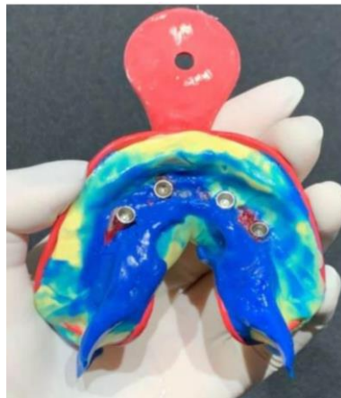
Figura 5 – Moldeira de escolha N°5, moldagem com silicone de condensação (Optosil® / Xantopren® Kulser – São Paulo – Brasil)

Após união dos transferentes com resina acrílica (Pattern Resintm LS - GM América, São Paulo – São Paulo – Brazil) foi realizado seleção da moldeira e a moldagem com o uso do silicone propriamente dita dos implantes (Figura 5).