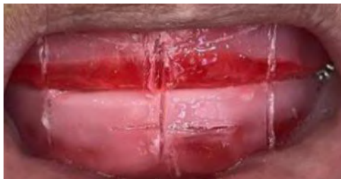
Figura 7 – Prova em cera (Cera Utilidade Rosa – Lysanda – São Paulo – São Paulo – Brasil e (Cera 7 Rosa Lâmina – Lysanda – São Paulo – São Paulo – Brasi) e demarcações das linhas do sorriso com o uso Esculpidor Lecron – Fava - Fortaleza dos Valos – Rio Grande do Sul – Brasil).

Com as moldagens finalizadas e início da construção protética laboratorial, foi realizado a prova em cera e demarcações do sorriso (linha média, linha alta e linha canina) para montagem dos dentes (Figura 7).