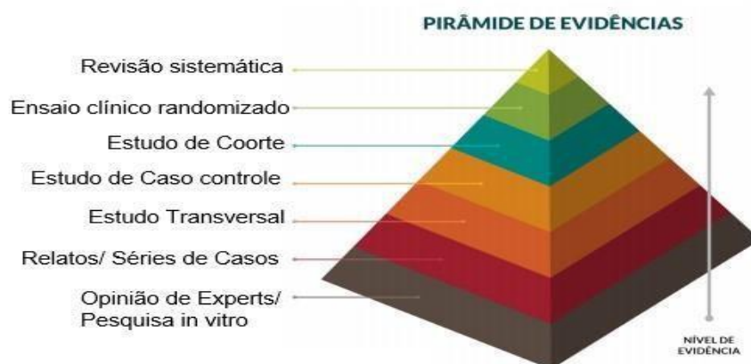
Figura 2- Níveis de Evidência.

Optou-se pela análise em forma estatística e de forma de texto, utilizando cálculos matemáticos e inferências, que serão apresentados em quadros e tabelas para facilitar a visualização e compreensão. Os artigos que foram selecionados conforme ao grau nível de evidência, ao considerar o planejamento de pesquisa de cada estudo de forma metodológica e característica.