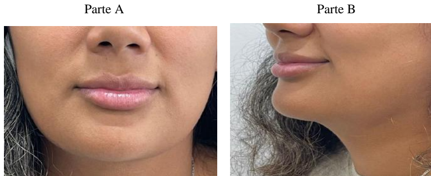
Figura 2 – Paciente após 7 dias de tratamento.