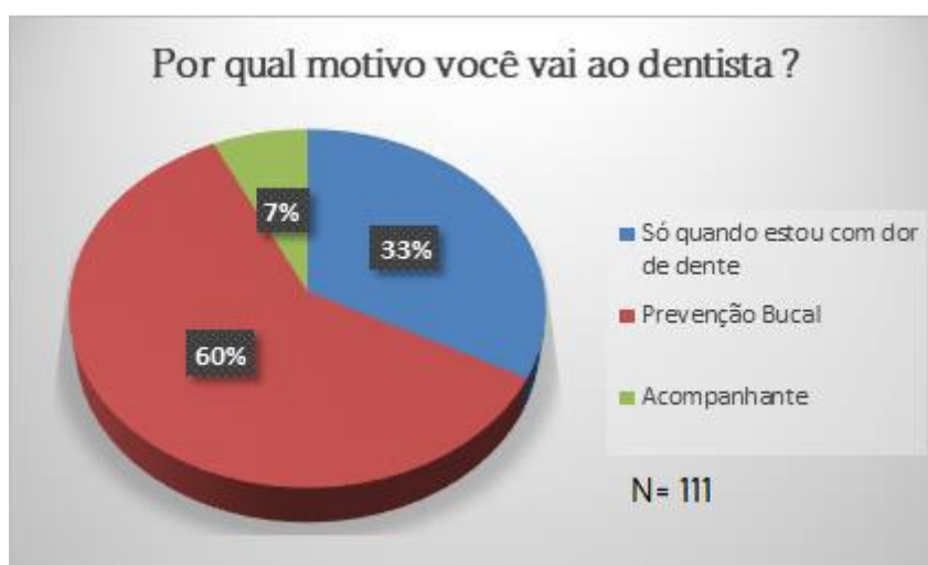
Figura 1 - Respostas dos participantes sobre o motivo da procura pelo atendimento.

Em relação ao motivo que levava os participantes a procurarem o atendimento odontológico, 20% responderam que procuravam quando sentiam algum tipo de dor, e 60% procuravam para prevenção de doenças e cáries conforme Figura 1.