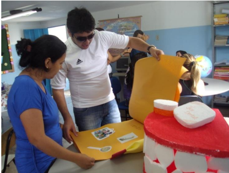
Figura 1: Capacitação dos educadores sobre saúde bucal com a utilização de materiais lúdicos e interativos.