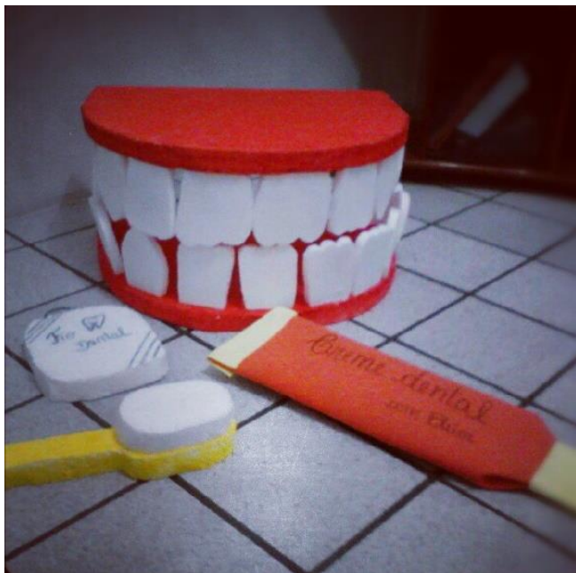
Figura 2: Materiais lúdicos confeccionados pelos extensionistas junto como os educadores.

Durante as oficinas de saúde, os educadores puderam aprender a confeccionar materiais que os auxiliariam a trabalhar o tema saúde bucal em sala de aula, de forma lúdica e prazerosa. Os materiais produzidos foram: macromodelo da boca, escova de dente, creme dental em EVA, álbum seriado e alguns jogos educativos. As oficinas foram realizadas uma vez por mês, com metodologia simples, baseada na realidade local e linguagem acessível, para que a informação fluísse de forma efetiva, incentivando os educadores a fazerem da mesma maneira com os seus alunos. A Figura 2 mostra alguns materiais produzidos pelos educadores durante as oficinas de saúde.