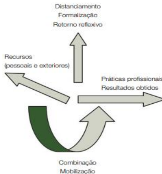
Figura 2 – A interação entre as dimensões da competência.

Le Boterf (2006) considera que a dinâmica posta em prática por um profissional que age com competência, e que é reconhecido como tal, ativa três dimensões da competência, que são as seguintes: primeiro, a dimensão dos recursos disponíveis (conhecimentos, saber-fazer, capacidades cognitivas, competências comportamentais) que ele pode mobilizar para agir; depois, surge a dimensão da ação e dos resultados que ela produz, isto é, a das práticas profissionais e do desempenho. Finalmente, há a dimensão da reflexividade, que é a do distanciamento em relação às duas dimensões anteriores. O esquema da Figura 2 pretende demonstrar a interação entre estas três dimensões, situando-se as duas primeiras num plano horizontal e a terceira num plano vertical.