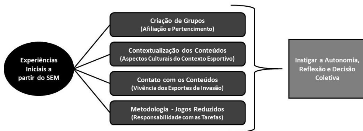
Figura 1. Experiências iniciais a partir do SEM.