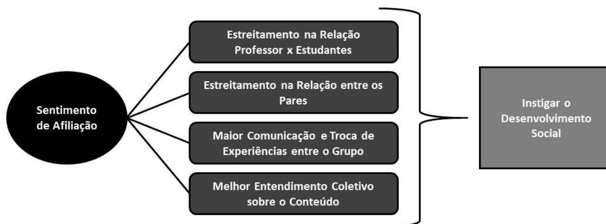
Figura 3. Desenvolvimento do sentimento de afiliação.

Durante o processo de intervenção pedagógica do SEM foi possível perceber que o trabalho em equipe possibilitou o desenvolvimento do sentimento de afiliação (Figura 3) entre os estudantes e o professor, como também entre os pares, melhorando as conexões existentes entre os mesmos.