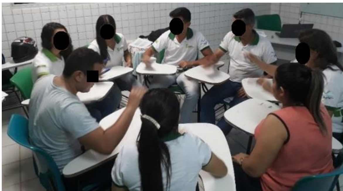
Figura 3. Roda de conversa.