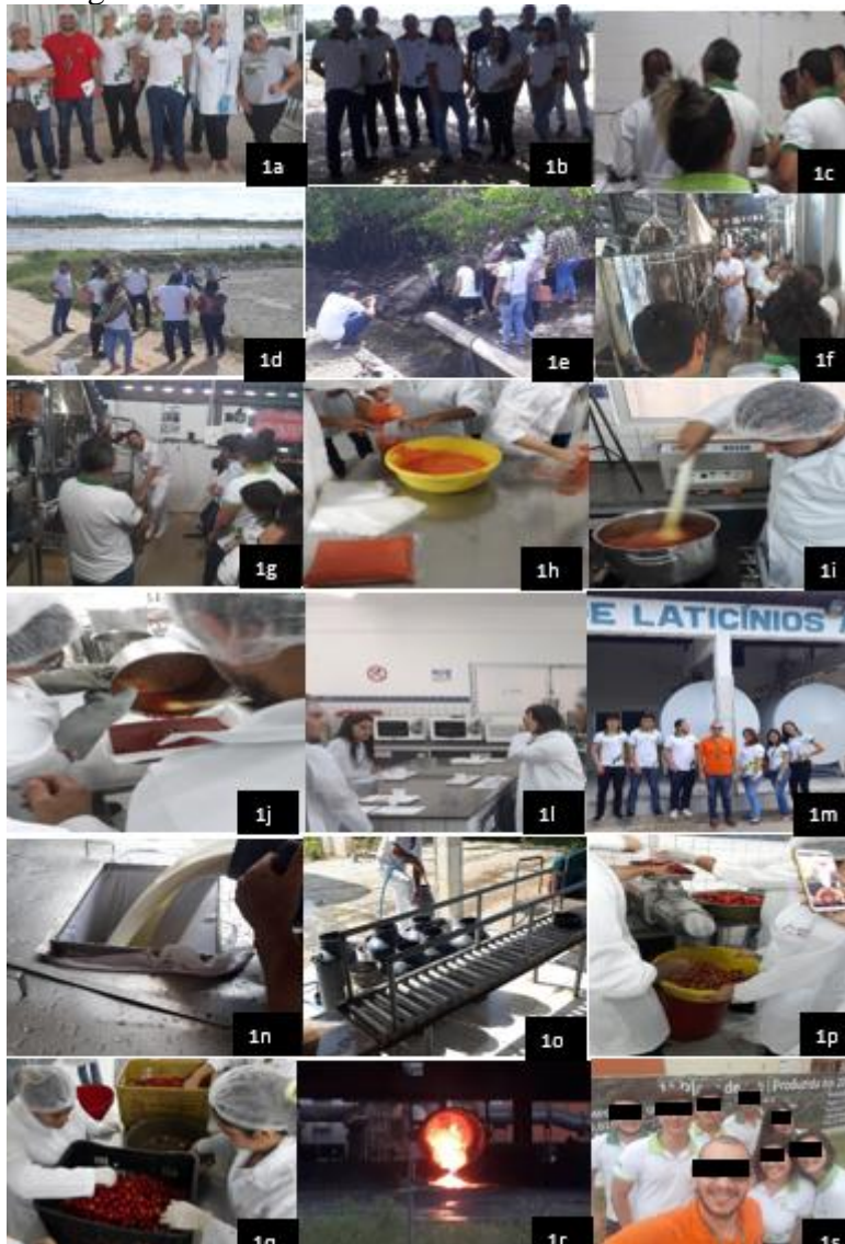
Figura 1. Registros das visitas técnicas.