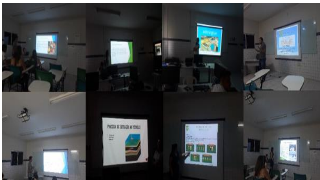
Figura 2. Apresentação dos Seminários.