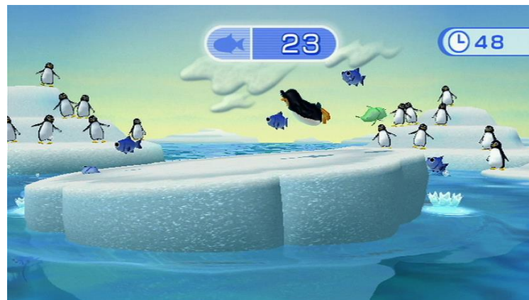
Figura 1. Jogo Penguin Slide .

Antes de iniciar o jogo, os participantes assistiram a um vídeo demonstrativo contendo orientações para sua execução. Os participantes jogaram o Penguin Slide por quatro minutos. Durante toda a execução do exergame, a atividade eletroencefalográfica foi mensurada pelo Emotiv EPOC ® .