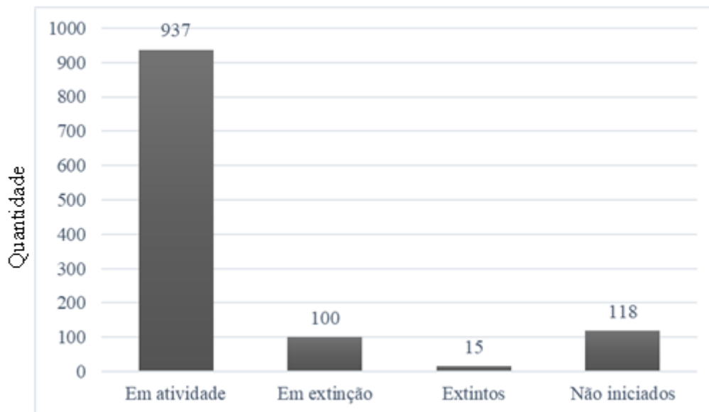
Situação dos cursos de Psicologia no Brasil