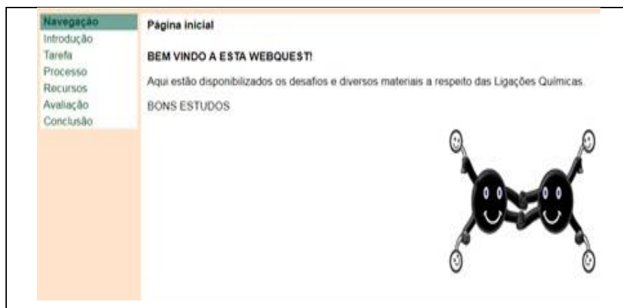
Figura 1: Página inicial da WebQuest.

Fonte: https://sites.google.com/site/ligacoesquimicas1/