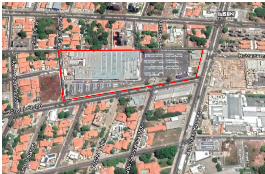
Figura 5: Terreno do antigo clube, com atual supermercado e estacionamento e área do entorno.