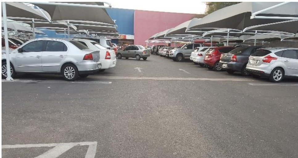
Figura 4: Estacionamento do supermercado construído na área do antigo Clube das Classes Produtoras do Piauí.

Para a implantação do supermercado, toda a vegetação do lote foi suprimida, tendo grande parte do terreno sido ocupada pela edificação, enquanto que, na área restante foi colocado piso impermeável, para possibilitar o estacionamento (Figura 4).