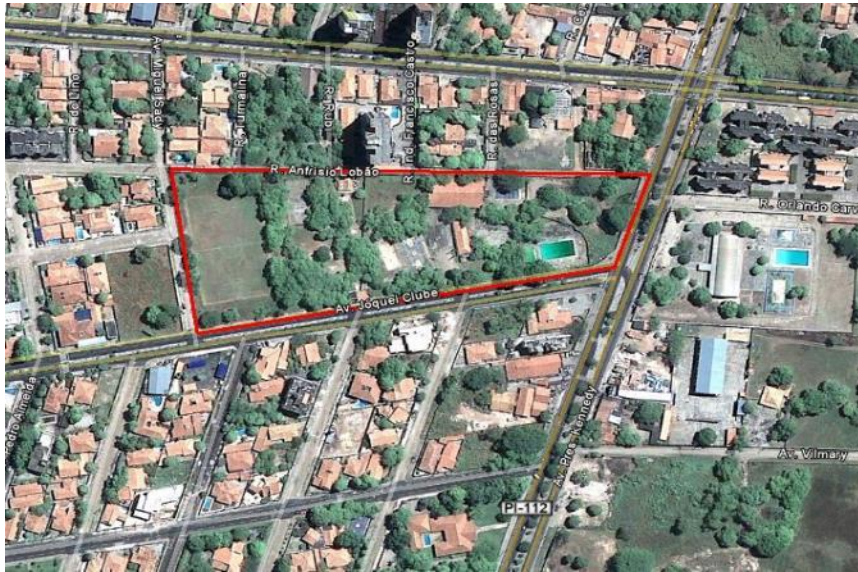
Figura 3: Área do antigo Clube das Classes Produtoras do Piauí, em 2007.