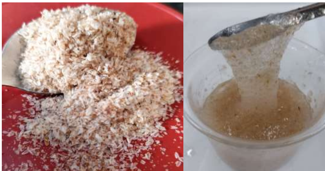
Figura 2 – Fibra de psyllium e gel de psyllium (fibra adicionada de água).

na Figura 2, principalmente, por arabinoxilanos, uma fração de xilose ligada à arabinose com potencial aplicação tecnológica e funcional nos alimentos (Van et al., 2009; Chong et al., 2019; Ren et al., 2020).