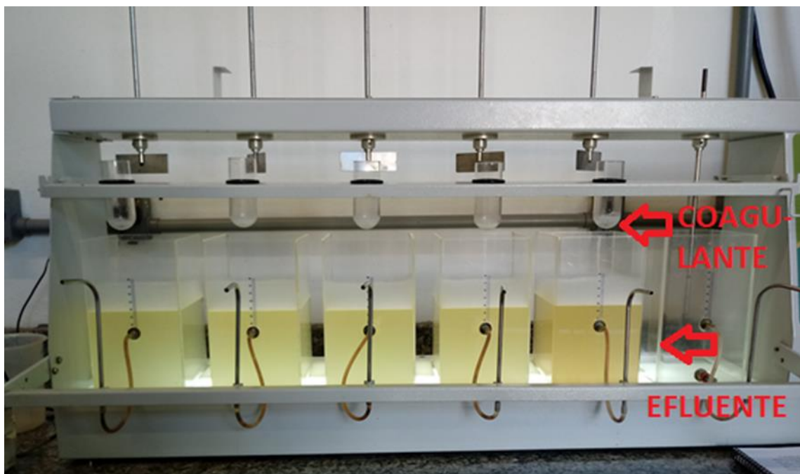
Figura 2. Ensaio de Jarrest, com as amostras e soluções coagulantes.

Nos jarros adicionou-se 1,5 L de efluente sintético e o volume de coagulante calculado para cada jarro conforme mostra a Figura 2.