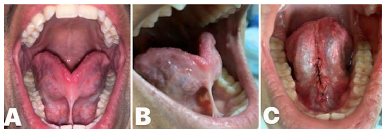
Figura 4. Frenectomia Lingual.

Em A, frênulo lingual antes do procedimento cirúrgico (vista frontal); em B, frênulo lingual antes do procedimento cirúrgico (vista lateral); em C, sutura após a incisão, secção do frênulo e divulsão das fibras.