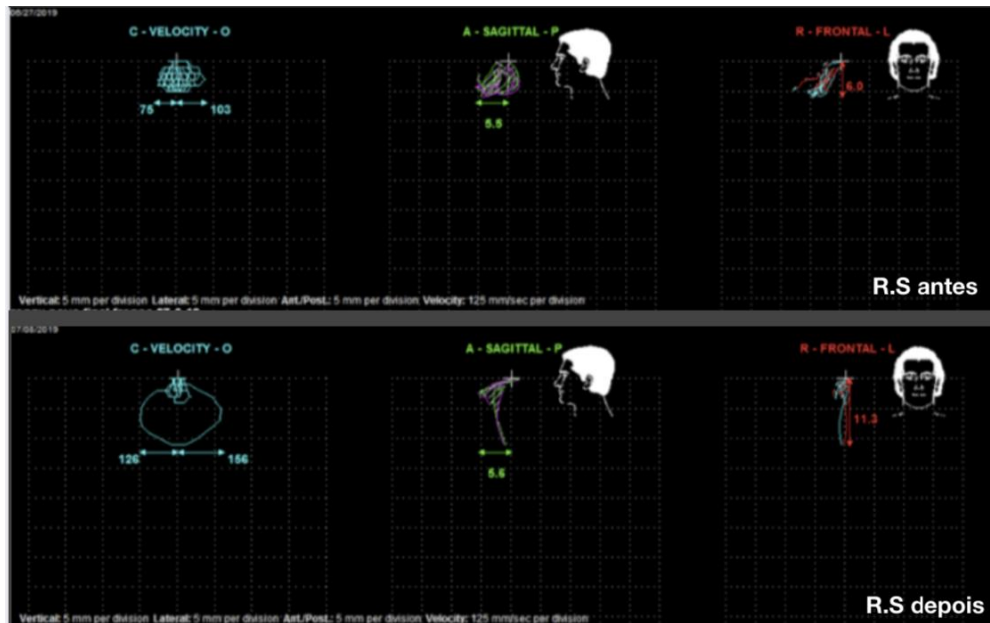
Figura 5. Gráfico apresentando as incoordenações, assimetrias e desvio de lateralidade à direita.

Legenda: Velocidades de fechamento “VF” ou C-close e de abertura “VA” ou O-open (azul) e das amplitudes, durante a fala, antes e depois da frenectomia lingual, nos planos sagital (verde) e frontal (vermelho).