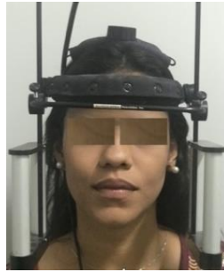
Figura 2. Eletrognatógrafo utilizado para análise dos movimentos mandibulares durante a fala.