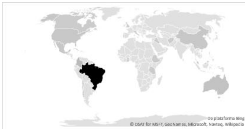
Figura 2. Países onde foram desenvolvidos os estudos sobre vulnerabilidade em saúde (2002-2019). Fortaleza (CE), Brasil, 2019.