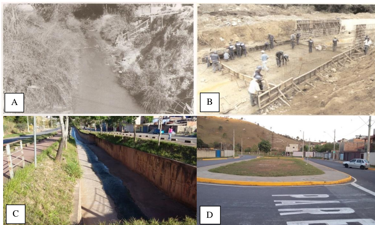
Figura 2 - Canal de drenagem da Avenida Cristina Gazire: (A) em leito natural no ano de 1998, (B) em obras de retificação no ano de 1998, (C) atualmente e (D) detalhe do uso do solo na região