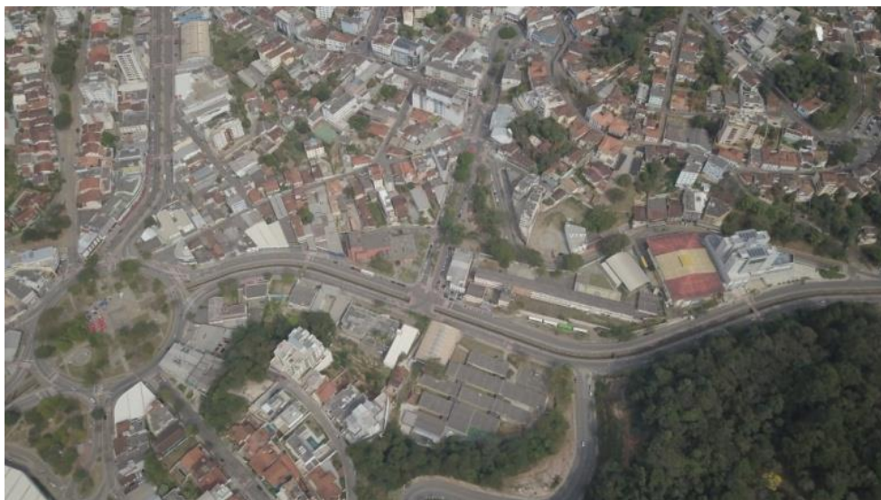
Figura 3 - Imagem panorâmica da Avenida Carlos Drummond de Andrade, notar área urbanizada na margem direita do canal e na margem esquerda, o Parque Municipal Mata do Intelecto, Itabira (MG)