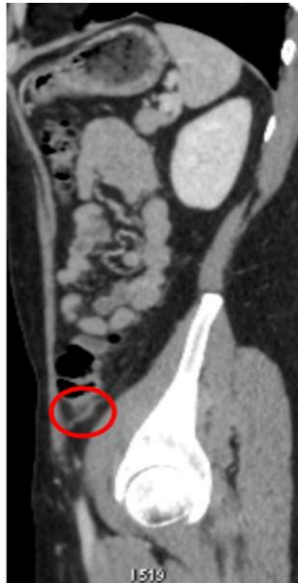
Figura 1. Corte sagital de TC de abdome total com contraste endovenoso, na fase porta.

Assim sendo foram solicitados exames laboratoriais, tomografia computadorizada de abdome total e colonoscopia. A tomografia computadorizada de abdome inferior demonstrou um achado ovoide com densidade adiposa, com a dimensão de 1,5 x 0,8 cm, com região central hiperdensa, na porção antimesentérica do colón descendente, associada à discreta densificação dos planos adiposos adjacentes, espessamento da parede do colón justaposta e espessamento da fásia lateroconal esquerda, sugerindo Apendagite Epiploica incipiente, no colón esquerdo, demonstrado nas Figuras 1, 2 e 3. Os demais exames não apresentaram anormalidades.