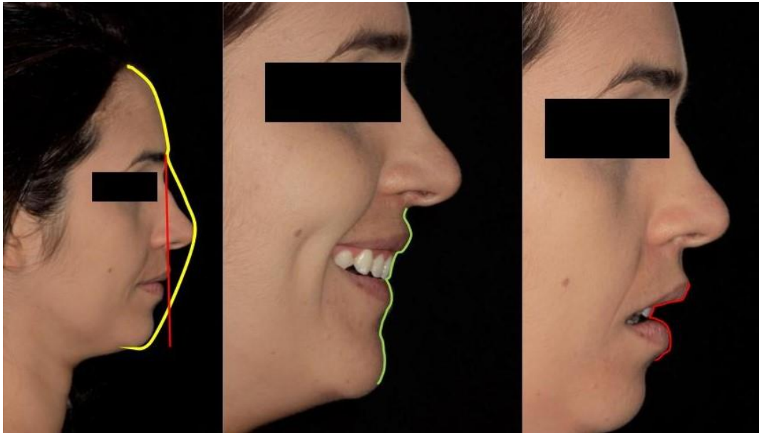
Figura 2 - Análise do rosto e do perfil.