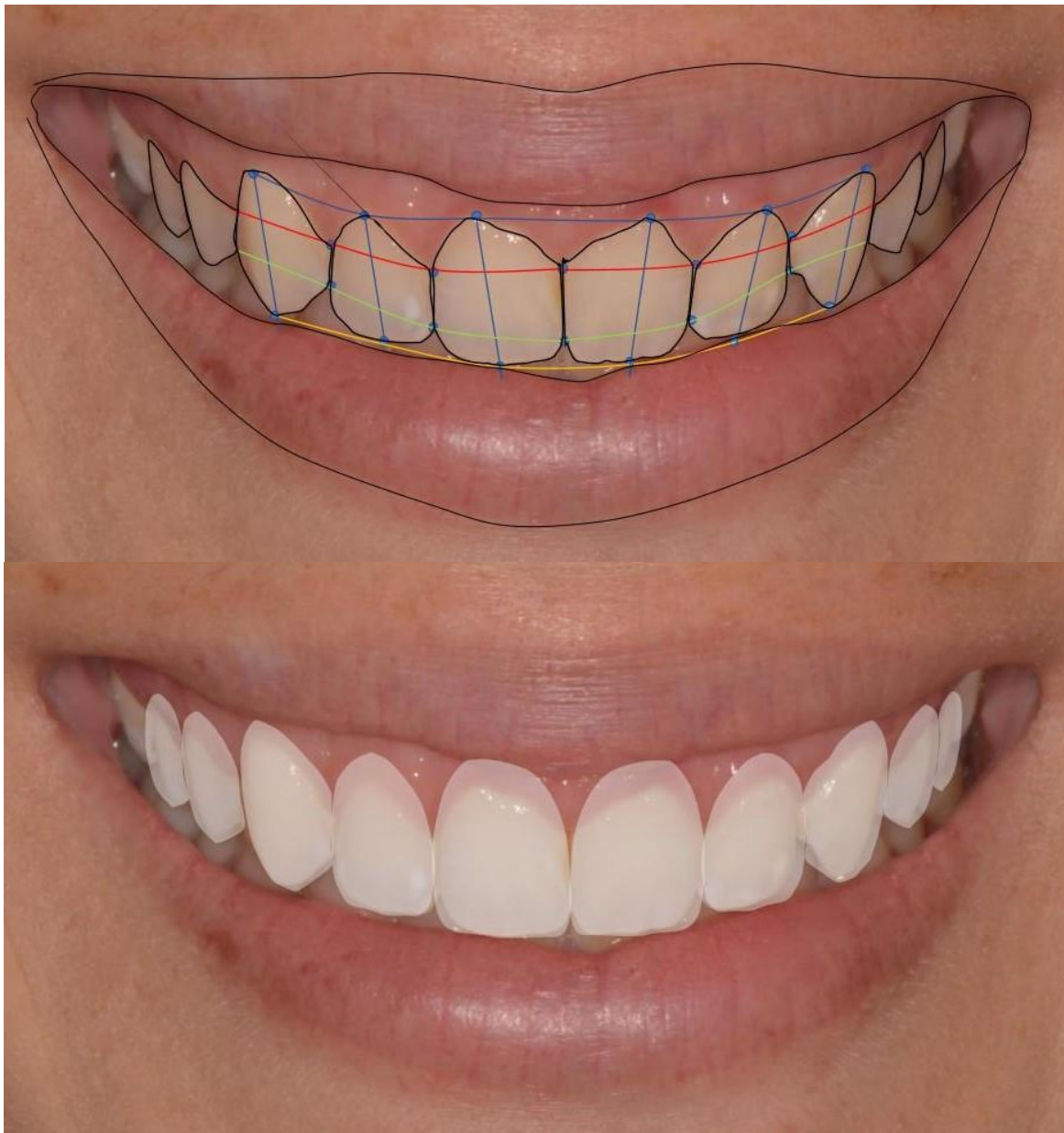
Figuras 6 e 7 - Desenho realizado através do Microsoft PowerPoint.