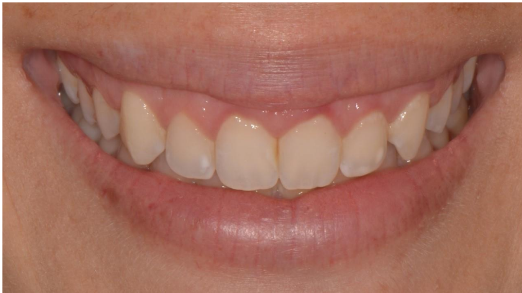
Figura 3 - Sorriso da paciente evidenciando deficiências estéticas.

Em uma análise intra oral, observou-se como principais deficiências estéticas, dentes pequenos, pequenos defeitos de esmalte e grande exposição gengival conferindo a paciente um sorriso com aparência juvenil (Figura 3).