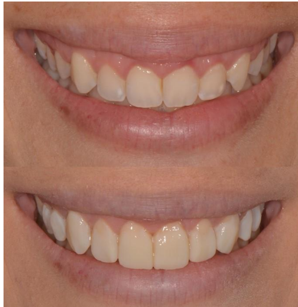
Figura 8 - Antes e depois do mock up.