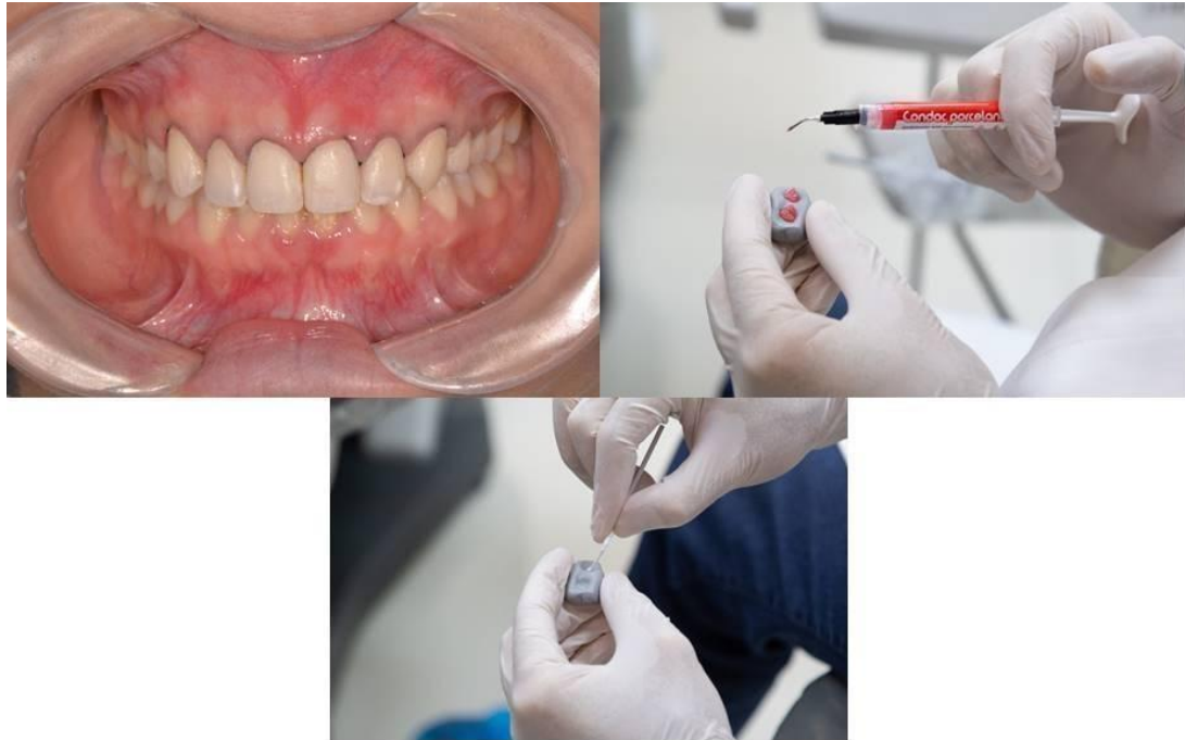
Figura 10 - Preparo do dente e da peça para cimentação.

(E-max, Ivoclar Vivadent, Barueri/SP, Brasil) com a cor BL4. Nas imagens é possível verificar algumas etapas do processo de prova e cimentação dos laminados (Figura 10).