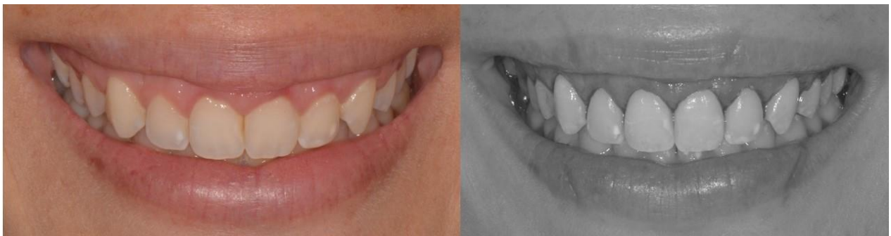
Figura 9 - Antes da cirurgia periodontal e pós cirúrgico imediato.

Após a análise facial e planejamento do caso, foi realizado o aumento de coroa clínica com finalidade estética dos dentes anteriores superiores, através de gengivoplastia e osteotomia flapless. Com este procedimento foi possível aumentar o comprimento dos dentes e harmonizar os zênites gengivais (Figura 9).